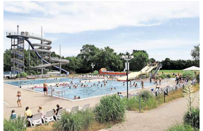
Im Schwimmbad P3 in Peine sowie dem Wendeburger Auebad müssen Besucherinnen und Besucher bestimmte Regeln beachten.

Zudem posten Besucherinnen und Besucher nicht selten ihre Selfies vom Freibadtag in sozialen Netzwerken. Die Regelungen zum Fotografieren unterscheiden sich zwar von Freibad zu Freibad. Doch die Haus- und Badeordnung im Peiner