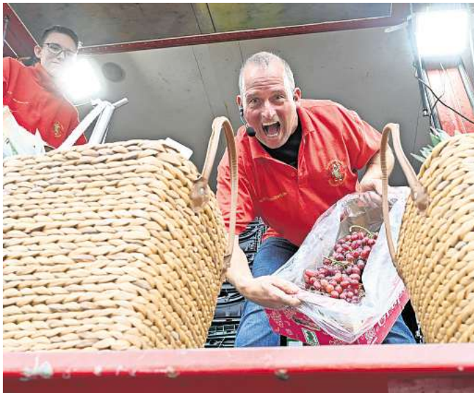
Marktschreier sind auch in diesem Jahr wieder mit von der Partie.

Spaß sowohl für Kinder als auch für Erwachsene in Fahrgeschäften und Karussells ist vorprogrammiert. Für das leibliche Wohl ist mit herzhaftem, süßem sowie natürlich auch flüssigem Angebot in großer