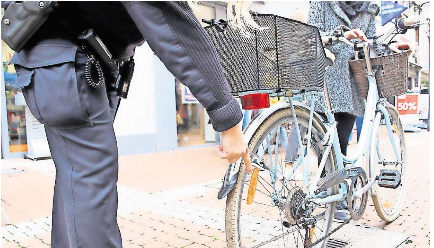
Bei der Verkehrskontrolle der Polizei Peine – hier in der Fußgängerzone – standen vor allem die Radfahrer im Fokus.

Die Verstöße: Radler sind unerlaubt in der Fußgängerzone gefahren oder sie waren auf Radwegen in nicht zulässiger Richtung unterwegs. Autofahrer haben unerlaubt auf Radwegen beziehungsweise im Halteverbot