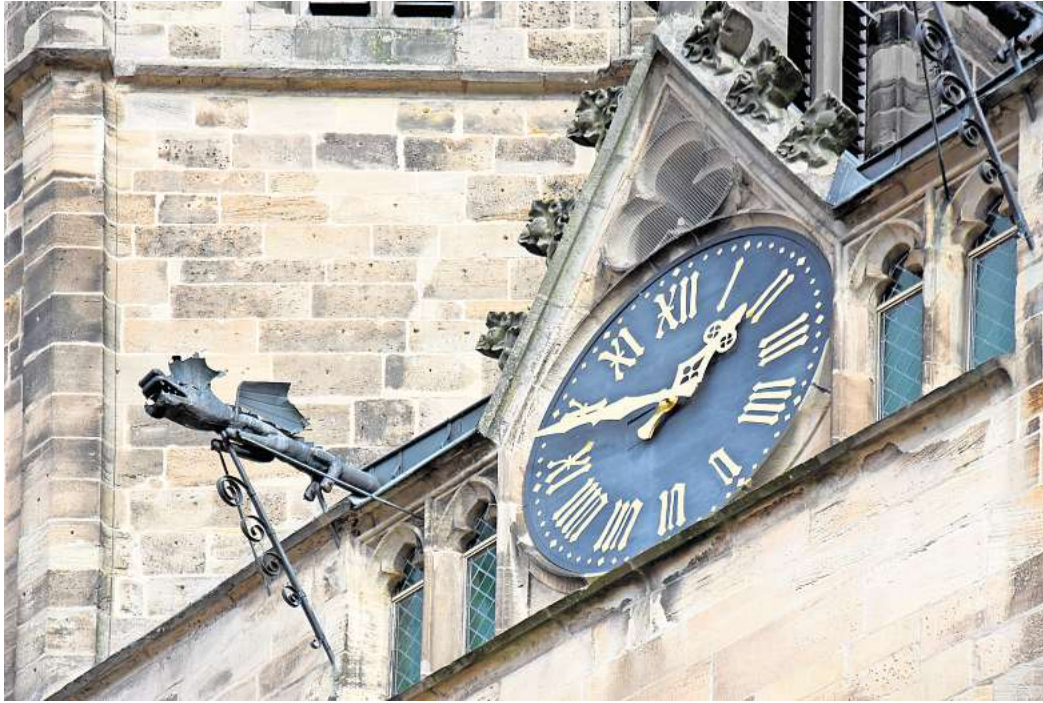
Die Uhr wird Ende Oktober von Sommerzeit auf Winterzeit umgestellt.

Wir würden gerne Ihre Meinung wissen: Was halten Sie davon, zweimal jährlich die Uhren umzustellen? Machen Sie mit bei unserer Umfrage und gewinnen Sie einen 50-Euro-Gutschein von Media Markt.