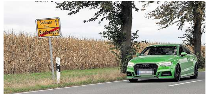
Der Ortseingang von Bierbergen in Richtung Soßmar. Zufällig fährt gerade ein ähnliches Auto wie das Fluchtfahrzeug vorbei. Der Unfallverursacher konnte jedoch noch immer nicht ermittelt werden.

Während die Diskussion um Sicherheit und Verantwortung weitergeht, bleibt der entscheidende Punkt aber ungelöst: Wer saß am Steuer des neongrünen Audis? Und warum konnte der Fahrer oder die Fahrerin bis heute nicht ermittelt werden?