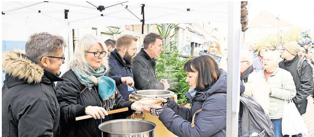
Großer Andrang und viele helfende Hände: Der Erbsensuppenverkauf für „Keiner soll einsam sein“ war erneut ein Renner.

Auch das Ehepaar Oehlerking aus Ilsede war extra früh aufgebrochen und nahm sich die Zeit, zum Erbsensuppenstand zu kommen. Auch dessen Fazit lautete: „Die Suppe ist