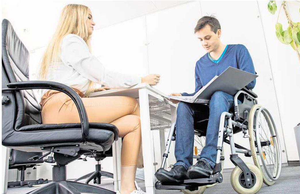
Wie hoch der Pauschbetrag ausfällt, hängt vom Grad der Behinderung ab.

Ganz automatisch gibt es diesen Pauschbetrag allerdings nicht. Er muss im Rahmen der Steuererklärung - mit Ausfüllen der Anlage „Außergewöhnliche Belastungen“ - beim Finanzamt beantragt werden. Bis zum vergangenen Jahr war einem solchen Antrag eine entsprechende Bescheinigung über die Behinderung etwa vom zuständigen Versorgungsamt oder die Kopie des Behindertenausweises vorzule-