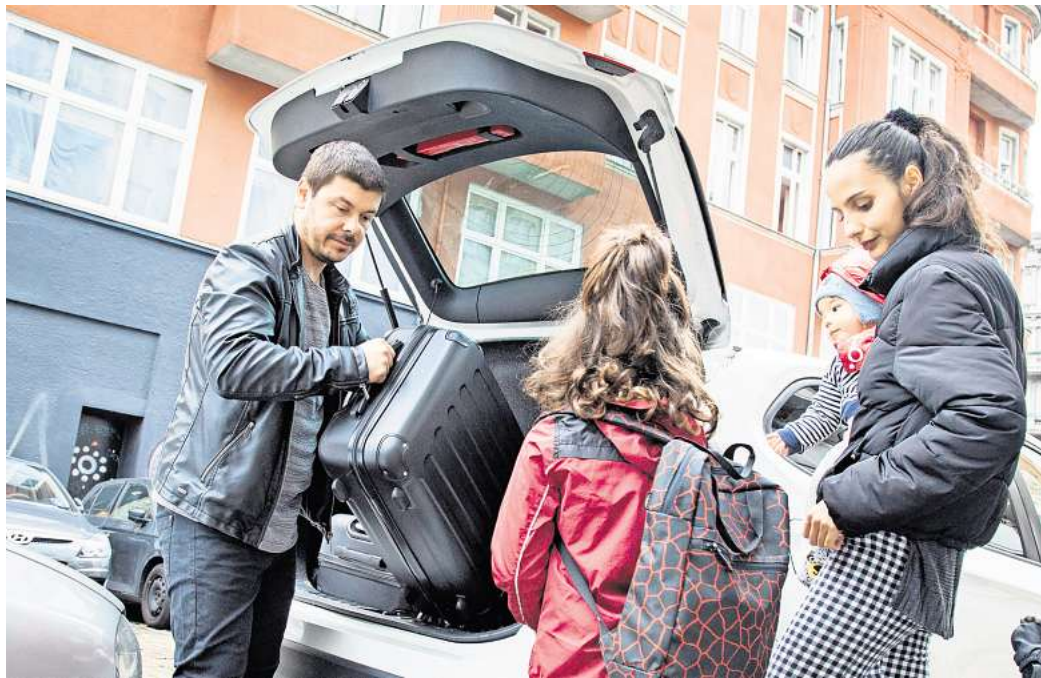
Für Reisegepäck oder Wertsachen im Handschuhfach oder Kofferraum kommt eine Kaskoversicherung nicht auf.