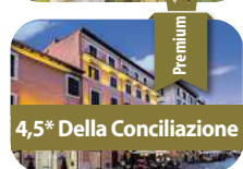
4,5* Della Conciliazione