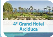
4* Grand Hotel Arciduca