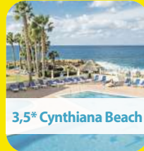
3,5* Cynthiana Beach