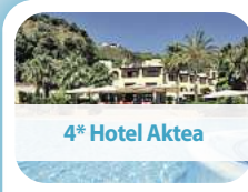
4* Hotel Aktea