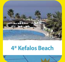
4* Kefalos Beach