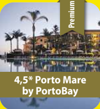
4,5* Porto Mare by PortoBay