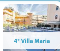
4* Villa Maria

8 Tage pro Person ab € 799,- 07.04. – 14.04.2026 14.04. – 21.04.2026 (+ € 25,-) RESTPLÄTZE! AUSGEBUCHT!