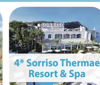
4* Sorriso Thermae Resort & Spa

8 Tage pro Person ab € 799,- 07.04. – 14.04.2026 14.04. – 21.04.2026 (+ € 25,-) RESTPLÄTZE! AUSGEBUCHT!