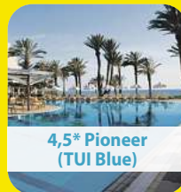
4,5* Pioneer (TUI Blue)