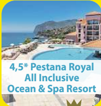
4,5* Pestana Royal All Inclusive Ocean & Spa Resort