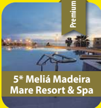
5* Meliá Madeira Mare Resort & Spa

8 Tage pro Person ab € 899,- 02.04. – 09.04.2026 Feiertag Feiertagstermin