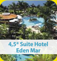
4,5* Suite Hotel Eden Mar

8 Tage pro Person ab € 899,- 15.04. – 22.04.2026