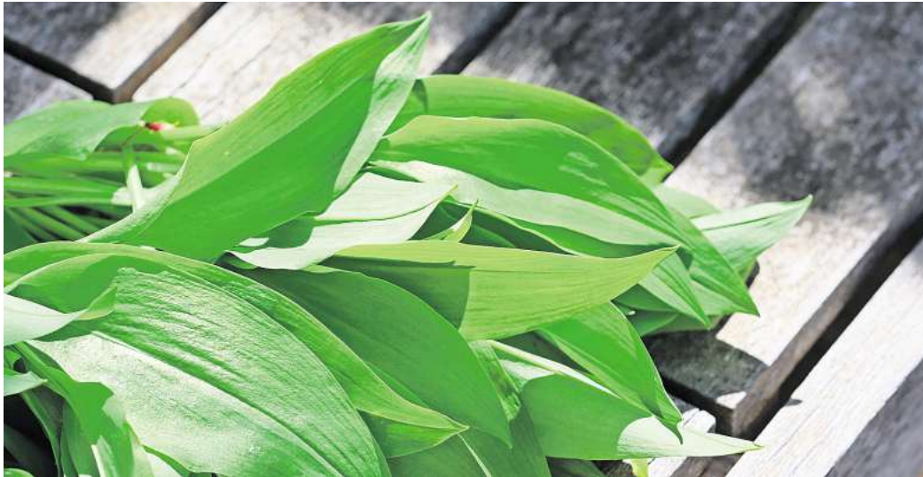
Sicher ist sicher: Wer unsicher ist, sollte auf Bärlauch aus kontrolliertem Anbau zurückgreifen, um das Risiko einer Verwechslung und damit einer Vergiftung zu vermeiden.

Auf den Geruch beim Reiben der Blätter kommt es an