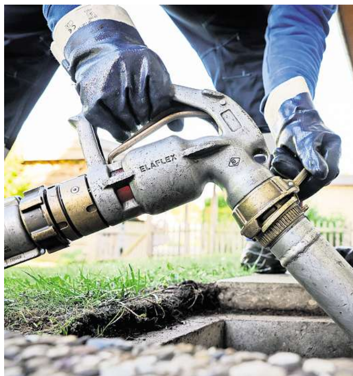
Wer jetzt unbedingt Heizöl benötigt, sollte nur so viel kaufen, wie unbedingt benötigt wird und die weitere Entwicklung der Preise im Blick behalten.

Wem ein solches Szenario widerfährt, sollte darum in der Praxis darauf bestehen, dass der Händler den Vertrag erfüllt - also die bestellte Menge Heizöl zum vereinbarten Preis und Liefertermin zur Verfügung stellt. Weigert sich der Händler trotz erneuter Fristsetzung, bleibt Betroffenen Lassek zufolge nichts anderes übrig, als Heizöl an anderer Stelle zu einem höheren Preis zu kaufen.