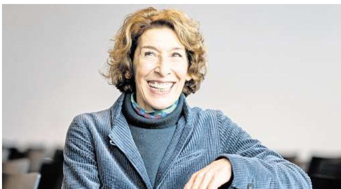
Adele Neuhauser, Schauspielerin, aufgenommen beim Presse-Filmbrunch des Bayerischen Rundfunks im Literaturhaus.

Dabei gehe es aber nicht um klassische Märchenverfilmungen. „Nein, nein, schon ein bisschen moderner.“ (dpa)