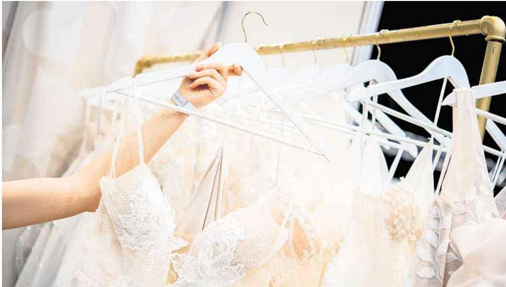
Wer ein Brautkleid sucht, hat die Qual der Wahl - auch bei der Frage: Online kaufen oder im stationären Handel?

Eine oft unterschätzte Alternative sind Doris Nothnagel zufolge sogenannte Sample Sales. Wenn Brautmodengeschäfte ihre Kollektionen wechseln, verkaufen sie Ausstellungsstücke häufig