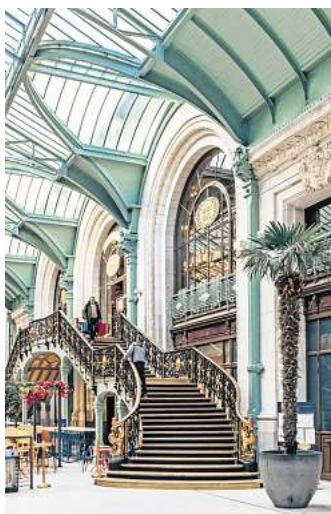
Der Eingang zum Restaurant „Le Train Bleu“ am Gare de Lyon.

Damit die Passagiere sich angemessen einstimmen konnten,