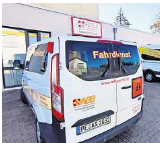
Die Tagespflege am Berkumer Weg in Horst: Der ASB holt die Senioren und Seniorinnen ab und bringt sie wieder nach Hause.

mer Weg verbindet dieses Ziel mit einem strukturierten und zugleich abwechslungsreichen Alltag. Die Gäste werden morgens abgeholt und am späten Nachmittag oder Abend zurückgebracht. Während des Tages erleben sie Gemeinschaft, Aktivität und individuelle Betreuung. Die Pflegeversicherung übernimmt, abhängig vom jeweiligen Pflegegrad, einen Großteil der Kosten. Wer mehr wissen möchte, kann sich im Internet über die Seite www.asb-peine.de informieren.