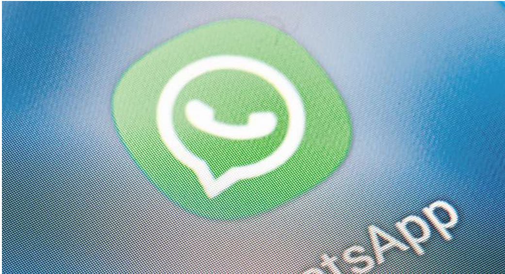
Weißer Sprechblase mit Hörer auf grünem Grund: So kennt man das WhatsApp-Icon - in der Plus-Variante gibt es dafür mehr Optionen, etwa in Rot, Lila oder Schwarz.