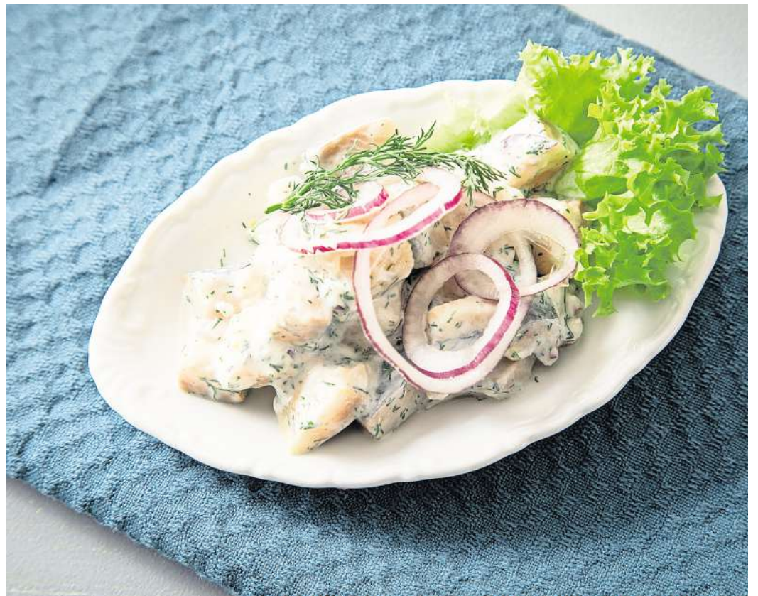
Ein Klassiker unter den Heringsgerichten: Matjes mit Zwiebeln und Sahneseife.

Gekühlter Matjes sollte laut Verbraucherzentrale auch zu Hause stets im Kühlschrank aufbewahrt und zügig gegessen werden. Dauerkonserven im