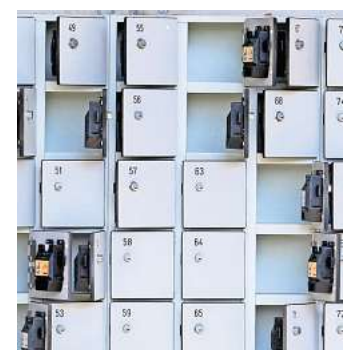
Bei einem Diebstahl aus einem verschlossenen Spind kommt die Hausratversicherung für den Schaden auf.

Dem BdV zufolge gibt es inzwischen zwar auch Hausrat-Tarife, die den einfachen Diebstahl einschließen - dann allerdings nur unter bestimmten Bedingungen und innerhalb bestimmter Entschädigungsgrenzen. Im Zweifel hilft es deshalb, zunächst ins Kleingedruckte zu schauen oder beim Versicherer nachzufragen. (dpa)