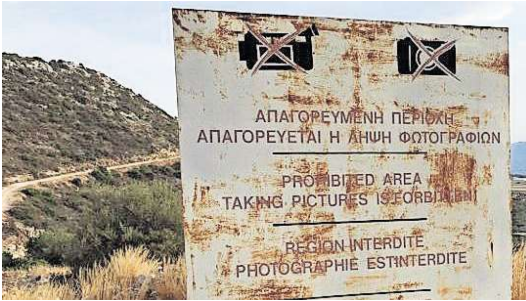
Dieses Schild ist kein Deko-Element. Fotografierverbote gelten in vielen Ländern, besonders rund um Militär- und Sicherheitsbereiche.

Zwar sei jedes betroffene Objekt mit einem Hinweis auf das Fotografierverbot gekennzeichnet