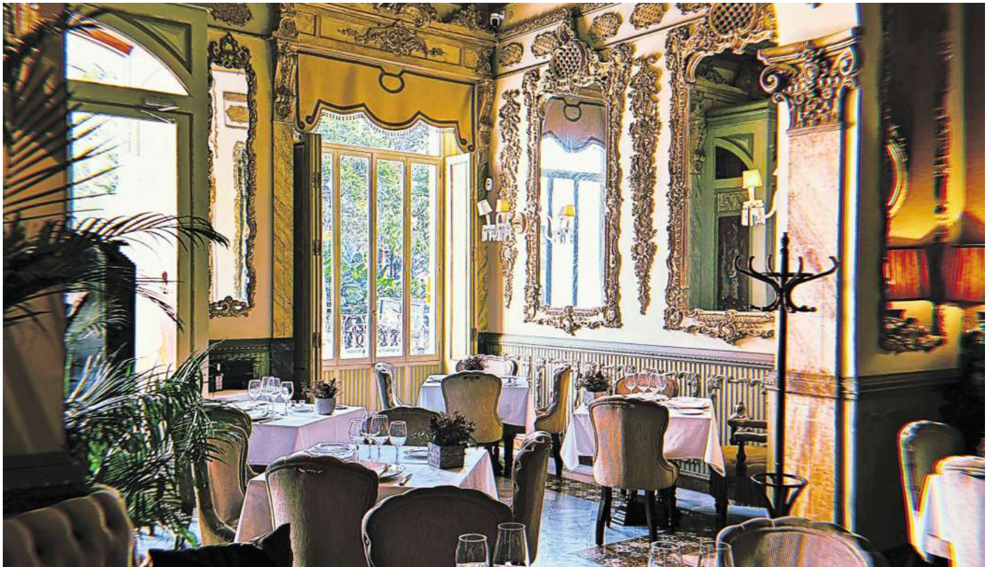
Das vielleicht schönste Café Spaniens befindet sich in Cádiz.