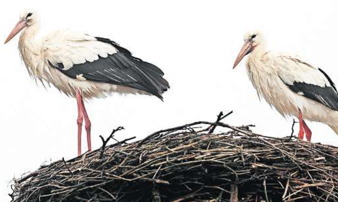
Fridolin und Mai sind mit wenigen Tagen Abstand in ihrem Nest am Nabu-Artenschutzzentrum in Leiferde eingetroffen.