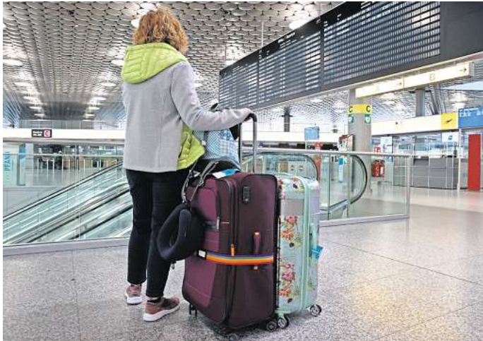
Bundesweiter Verkehrstreik am 27. März? Bahn, ÖPNV, Flughäfen und Autobahn wären betroffen.

Peiner Land. Keine Züge, keine Busse und Straßenbahnen, auch Flughäfen bestreikt: Die Eisenbahn-Gewerkschaft EVG und die Dienstleistungsgewerkschaft Verdi wollen am 27. März einen halben Tag lang den Verkehr in Deutschland lahmlegen. Der Streik soll mit Tagesbeginn am Montag, dem 27. März anfangen. Am Nachmittag muss der Arbeitskampf unterbrochen werden: Dann treffen sich Verdi und Arbeitgeber zur bisher dritten Verhandlungsrunde in Potsdam. Bis zum 29. März soll verhandelt werden. Verdi fordert in der laufenden Tarifrunde für die Angestellten von Bund und Kommunen 10,5 Prozent mehr Gehalt, mindestens aber 500 Euro mehr im Monat bei einer Laufzeit von zwölf Monaten. Was meinen Sie? Was halten Sie von dem bundesweiten Verkehrstreik? Stimmen Sie ab. Unter allen Teilnehmenden verlosen wir fünf PAZ Jahres-Abos für Abo-Plus. Vergangene Woche wollten wir