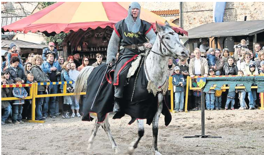
Beinahe wie im Mittelalter: Kostümierte Ritter werden ihre Kampfkünste in Shows präsentieren.

Alle Informationen zum Mittelalterfest gibt es im Internet unter www.braunschweig.heiterhaufen.de