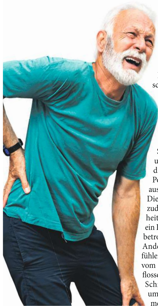
Abbildung Betroffenen nachempfunden