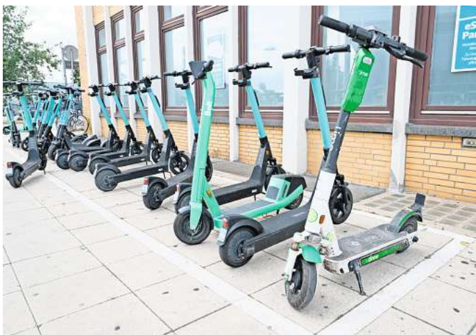
Besonders an Bahnhöfen findet man in der Regel viele E-Scooter der verschiedensten Anbieter.

In der letzten Woche wollten wir von Ihnen wissen, was Sie von