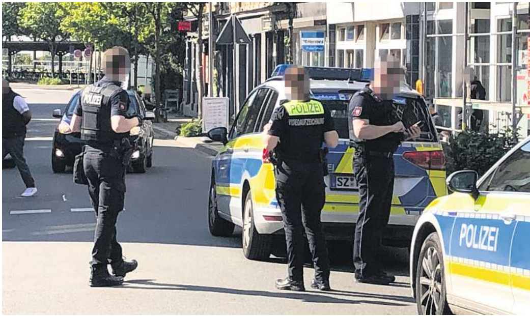
Hier passierte die Schlägerei: Die Polizei hat die Kreuzung Braunschweiger Straße/Neue Straße gesichert

Vorausgegangen war nach Angaben der Polizei ein Streit zwischen Kindern auf dem Spielplatz an der Pflingstraße. Daraufhin hatten sich auch eine Mutter mit libanesischem Hin-