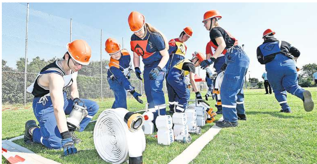
Bei den Jugendfeuerwehr-Wettkämpfen müssen auf Zeit festgelegte Aufgaben abgearbeitet werden.

Rund 100 junge Feuerwehr-Nachwuchskräfte im Alter von 10 bis 18 Jahren traten in acht Gruppen zu den verschiedenen Übungen gegeneinander an. Es waren Jugend-Teams aus Duttonstedt/Essinghausen, Mehrum, Peine