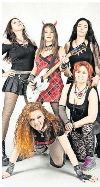
AC/DC-Show in Salder: Die Frauenband „Black Rosie“ kommt zur Rock-Party in den Schlosshof.

Weitere Reisen finden Sie unter www.schmidt-busreisen.de