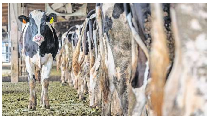
Tier- und Umweltschützer sind mit der Bilanz der Ampelkoalition zur Stärkung des Tierschutzes unzufrieden.

serung des Tierschutzes habe man in einem ersten Schritt die Tierhaltungskennzeichnung für frisches Schweinefleisch verabschiedet. Die solle ausgeweitet werden. Zu den dafür benötigten Geldern sagte Özdemir, der Ball liege beim Haushaltsgesetzgeber, dem Bundestag.