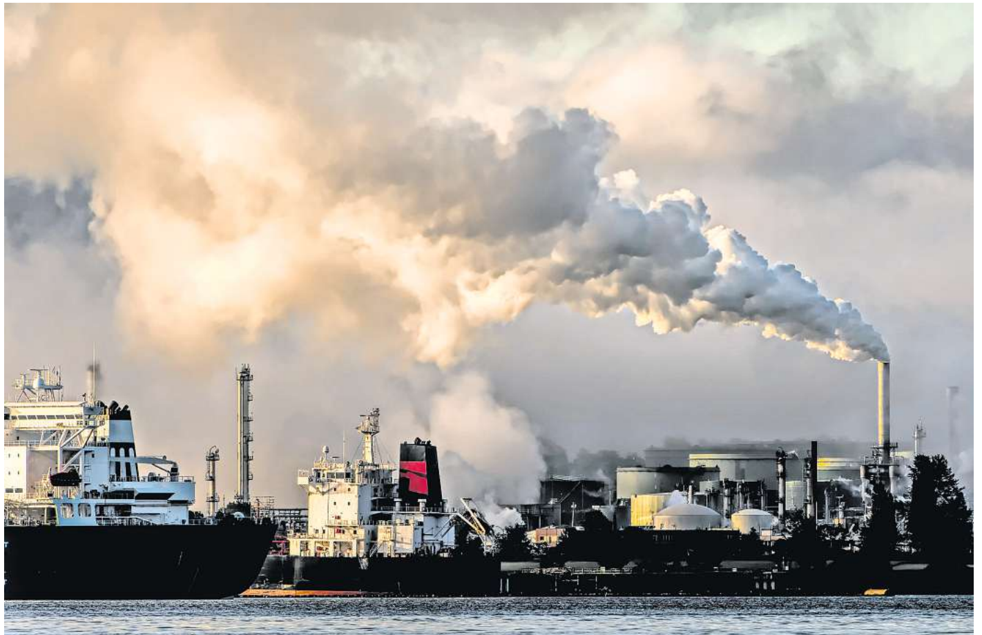
Ein breites Bündnis von Umweltverbänden und Bürgerinitiativen warnt vor massiven Klima- und Umweltschäden durch die unterirdische CO 2 -Speicherung.

Das Bündnis sieht in den Plänen lediglich eine Möglichkeit,