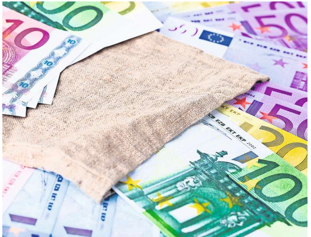
Geldfälscher in Deutschland und Europa haben im vergangenen Jahr deutlich mehr Blüten unters Volk gebracht.

Einen großen Anteil an den Blüten hatten in Deutschland auch im vergangenen Jahr mit 16 Prozent leicht erkennbare Fälschungen insbesondere von 10-