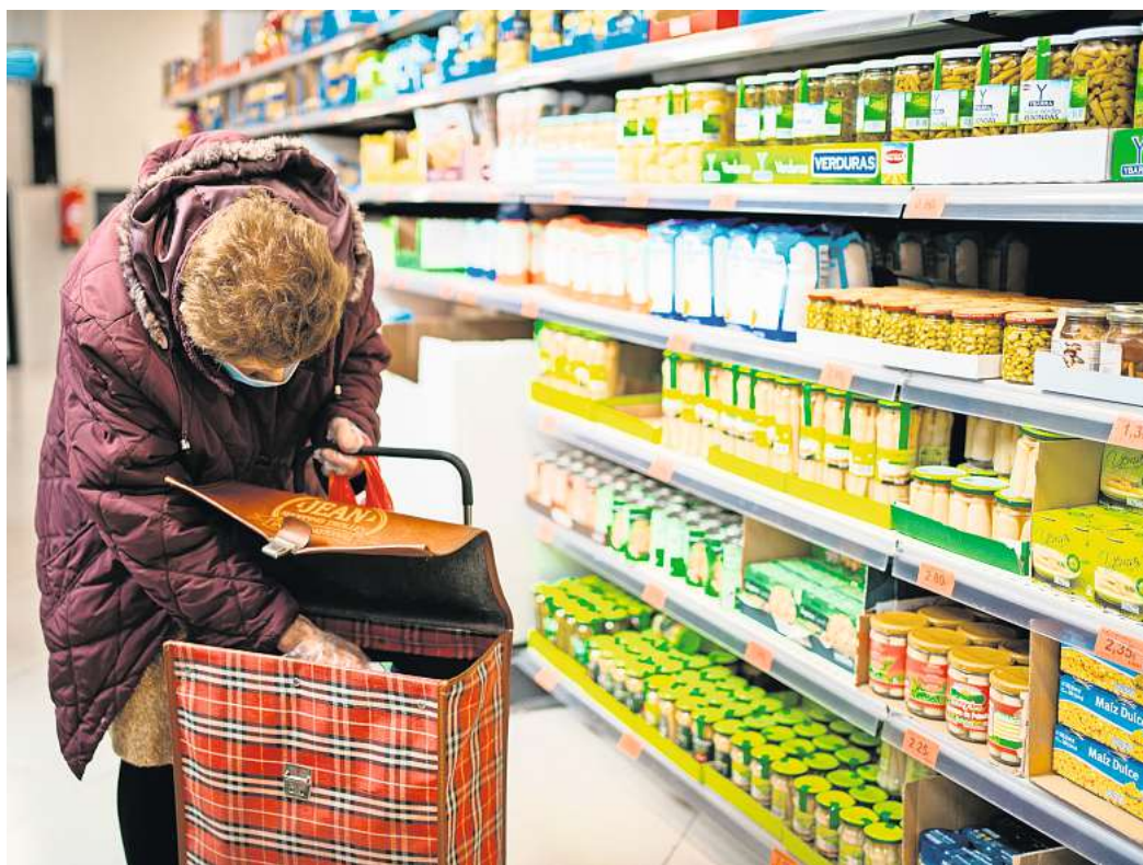
Hohe Lebensmittelpreise trotz sinkender Energiekosten: Nahrungsmittel sind zum Treiber der Inflation geworden.

Einerseits ist zu erkennen, dass die Preise inzwischen langsamer steigen als noch vor einigen Monaten. Andererseits verweisen Experten darauf, dass Nahrungsmittel und ihre Vorprodukte zunehmend stärker in den Weltmarkt integriert sind. Zum Beispiel beim Zucker: Die Notierungen an den Rohstoffbörsen sind enorm hoch. Im Dezember erreichten sie Rekordwerte. Das schlägt nun auf Süßwaren durch. Dazu beitragen dürfte, dass die weltgrößten Zuckerrohranbauer Thailand und Brasilien ihre Exporte in die EU deutlich verringert haben, weil der Rohstoff vermehrt für die lukrative Er-