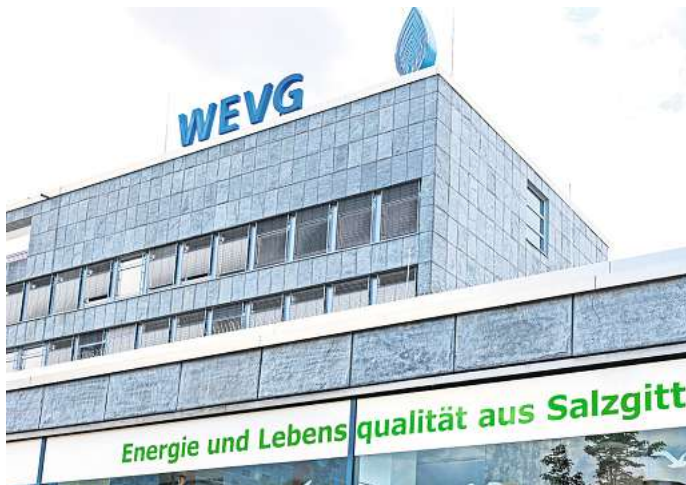
Muss die Preise erhöhen: Strom und Gas bei der WEVG Salzgitter werden zum 1. Mai 2024 teurer.

Zum 1. Mai 2024 steigt der Arbeitspreis für Erdgas um 1,07 Cent pro Kilowattstunde (inklusive 19 Prozent Umsatzsteuer). Auch hier bleibt der Grundpreis unverändert. Für Erdgas sind bei einem durchschnittlichen Jahresverbrauch von 14.000 Kilo-