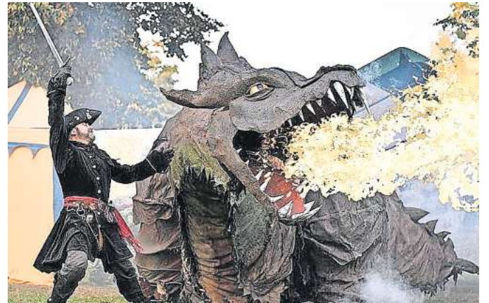
Fantasy-Theater: Der Drache Fangdorn kennt keinen Spaß, wenn es um den Schatz der Elfen geht.

der-Ritterturnier durchgeführt, bei dem die Recken des Landes die Ritterehre erkämpfen können. Auf dem handbetriebenen Riesenrad lässt sich das Marktreiben aus luftiger Höhe bestaunen und an verschiedenen Ständen können die kleinen, aber auch die großen Besucher ihr handwerkli-