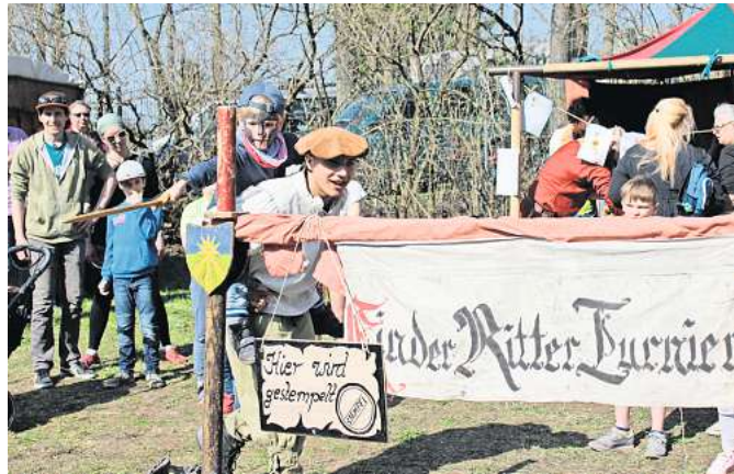
Ritter-Turniere, Eselreiten, ein handbetriebenes Riesenrad und mehr: Für Kinder wird jede Menge Unterhaltung geboten.

An beiden Veranstaltungstagen wird ein unterhaltsames Programm geboten. Musikalisch wird die Band „Klanginferno“ mit viel Witz und Charme alte Lieder auf den verschiedensten Instrumenten darbieten, ein Medikus vollbringt Wunder-Heilungen und „Orlando“ bringt in seiner Zaubershow das Publikum zum Staunen. Das Duo „Höllenslarm“ gibt wie gewohnt allerlei Blödsinn von sich und strapaziert damit garantiert die Lachmuskeln der Besucherinnen und Besucher. Ein großes Highlight wird sicher auch in diesem Jahr der Drache „Fang-