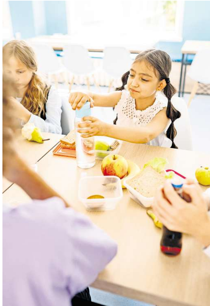
In Schulen und Kindergärten sollte es kostenloses Mittagessen geben, fordert der Bürgerrat für Ernährungspolitik.

Er enthält auch konkrete Vorgaben dazu, wie oft welche Lebensmittel in der Fünftageswoche in der Schulmensa auf der Speisekarte landen sollten: Obst, Milch und Milchprodukte zum Beispiel mindestens zweimal