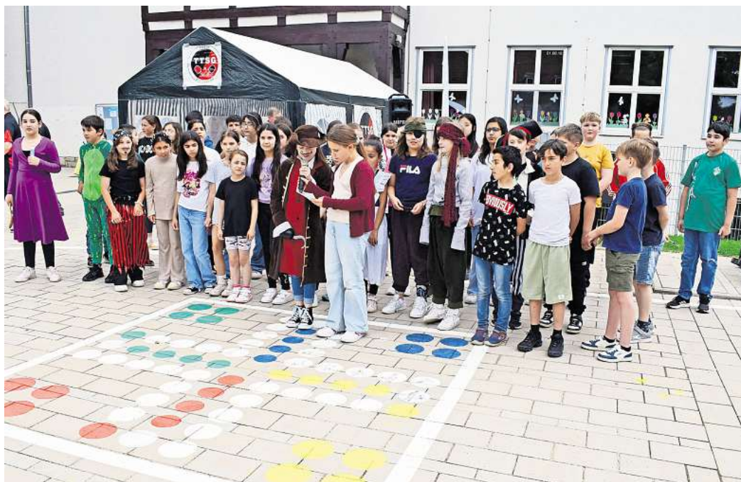
Feierliche Freigabe: Die Mädchen und Jungen der Grundschule Steterburg stimmten musikalisch auf die Eröffnung des Vorplatzes ein.

Stefan Klein erinnerte an den Spatenstich im Juli 2023 auf der