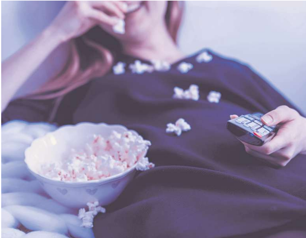
Mit „Hate Watching“ ist das Phänomen gemeint, Serien oder Filme zu schauen, die man eigentlich gar nicht mag.

Wenn die Dialoge mies, die Handlung dünn und die Darsteller untalentiert sind, man aber trotzdem aus verschiedenen Gründen gebannt zusieht: Das ist „Hate-Watching“. Realityformate wie die RTL-Dschungelshow „Ich bin ein Star – holt mich hier raus!“ mit ihren Ekelprüfungen sind ein Paradebeispiel: Viele fühlen sich abgestoßen, schauen aber dennoch bis zum Finale. Oder die Netflix-Serie „Emily in Paris“, in der eine junge Amerikanerin durch ein grotesk klischeehaftes Frankreich voller Baguettes und champagnertrinkender Charmeure stöckelt. Obwohl nicht einmal Fans diese Schwächen leugnen, kletterte die Serie auf