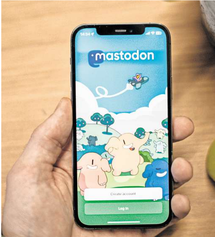
Das Wort Fediverse bildet sich aus den zwei Wörtern „Federation“ (deutsch: Vereinigung, Bund) und „Universe“ (deutsch: Universum).

Die Idee ist ganz einfach: Verschiedene soziale Plattformen verbinden sich in einem Netzwerk. Alle halten sich dabei an ein allgemein gültiges Protokoll, mit dem sich alle verständigen können: ActivityPub. Es gibt kei-