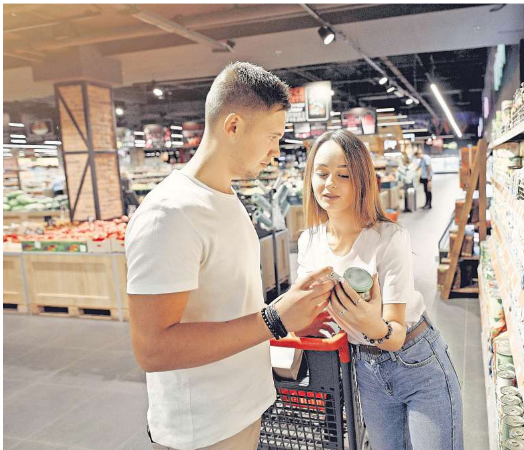
Ein Vorbild auch für Deutschland? In Frankreich schützt ein neues Gesetz Verbraucher vor Mogelpackungen. Ab dem 1. Juli müssen „Shrinkflation“-Produkte gekennzeichnet sein.

In Frankreich macht die Regierung jetzt Ernst. Große und mittelgroße Geschäfte müssen bald kenntlich machen, ob ein Nahrungsmittelprodukt von „Shrinkflation“ betroffen ist. Nimmt die Menge ab und der Preis bleibt unverändert oder steigt, muss in der Nähe des Produkts beispielsweise ein Plakat