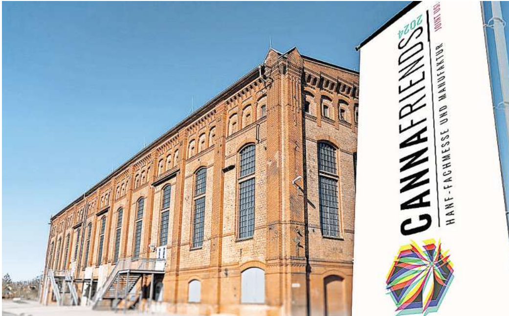
Die CannaFriends kommt nach Groß Ilsede: Norddeutschlands größte Hanfmesse gastiert vom 20. bis 22. September in der Gebläsehalle.

Dieses Jahr legt die Messe besonderen Fokus auf die vielfältigen Einsatzmöglichkeiten – von medizinischen Anwendungen bis zur Cannabis-Kultur, insbesondere im Zuge der jüngsten Legalisierung. Die Veranstaltung richtet sich nicht nur an Hanf-Enthusiasten, sondern auch an Interessierte, die mehr über die Potenziale von Cannabis erfahren möchten. Die Besucher und Besucherinnen können sich auf „eine spannende Mischung aus Information und Unterhaltung“ freuen. Auf der CannaFriends erwartet sie jedenfalls viel Abwechslung.