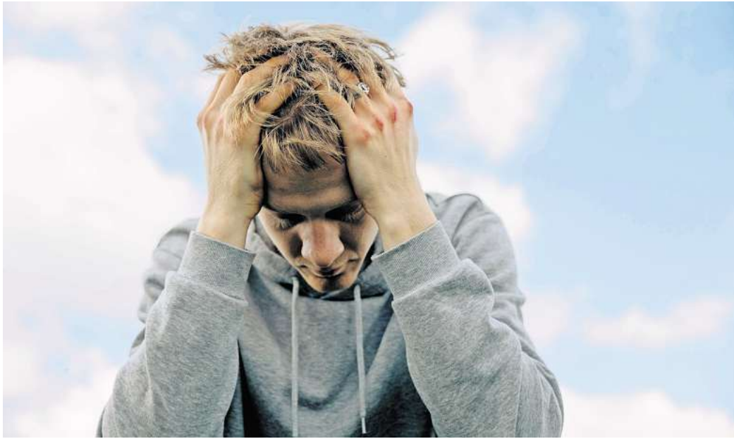
Wetter ist ein Faktor, der Einfluss auf unsere Gesundheit haben kann.

Starke Wetterveränderungen können laut dem Deutschen Wetterdienst (DWD) jedoch nachweislich Einfluss auf die Gesundheit haben. Epidemiologische Studien hätten gezeigt, dass die Beschwerden von Menschen mit hohem Blutdruck bei einer Kaltfront zunehmen würden, steht in einem Ratgeber des DWD und der Deutschen Seniorenliga über Wetterfühligkeit. Laut einem Bericht von Matzarakis für die Deutsche Herzzstiftung kann besonders kaltes oder warmes Wetter auch Auswirkungen auf die Herzgesundheit haben. Wenn die Temperaturen plötzlich fallen, müssten besonders Personen aufpassen, die an erhöhtem Blutdruck leiden, da die Verengung der Gefäße den Blutdruck noch