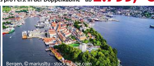
Bergen, © mariuslu - stock.adobe.com