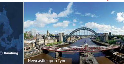
Newcastle upon Tyne