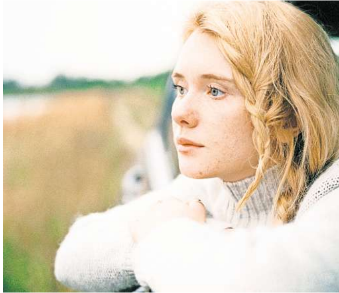
Ab und zu die Gedanken schweifen zu lassen, ist normal. Wenn Menschen sich aber stundenlang ihren Träumen überlassen kann zu einem Problem werden.

Somer hatte dies vermehrt bei Patientinnen und Patienten beobachtet, die in ihrer Kindheit missbraucht worden waren und sich nun häufig in Traumwelten flüchteten. Offiziell als eigen-