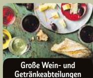
Große Wein- und Getränkeabteilungen