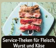
Service-Theken für Fleisch, Wurst und Käse