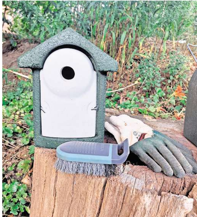
Der NABU gibt Tipps: Die Reinigung der Nistkästen ist eine wichtige Maßnahme, um die Gesundheit von Vögeln und anderen Tieren zu gewährleisten.

Bei der Reinigung des Nistkastens sollte man auf Überraschungen gefasst sein. Die NABU-Mitarbeiterin empfiehlt daher, bei den zu kontrollierenden Nistkästen kurz anzuklopfen, um mögliche Bewohner - wie Hasel- oder Waldmaus - zu warnen, damit sie flüchten können. Auch der Siebenschläfer hält sich häufig in Vogelnistkästen auf. Dieser sucht die Behausungen meist erst dann auf, wenn die Bewohner ausgeflogen sind. Zur Überwinterung ab Ende Oktober ziehen die Siebenschläfer allerdings lieber in frostfreie Erdhöhlen.