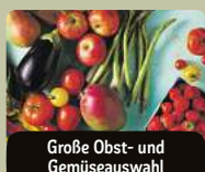
Große Obst- und Gemüseauswahl