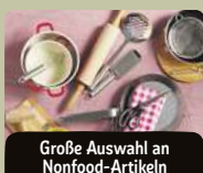
Große Auswahl an Nonfood-Artikeln