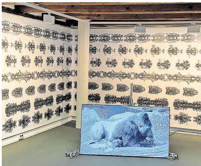
Kunst trifft Natur: Bis zum 10. November können sich die Gäste die Bilder und Installationen im „Salon Salder“ noch ansehen.

Am Sonntag, 27. Oktober, um 11.15 Uhr beginnt die Matinee „Georg Lichter“ mit Heinrich Römisch (Musik), Bernd Schulz (Künstler) und Tilmann Thiemig (Texte). Sie beschreibt