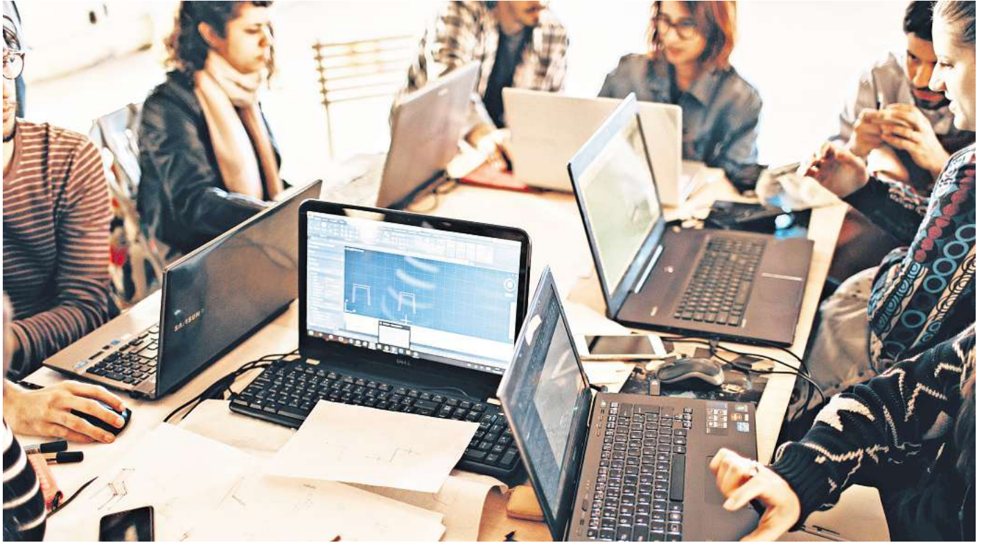
Nur jeweils etwa 7 Prozent aller Smartphones und aller Laptops in Unternehmen stammen aus zweiter Hand.

Warum muss es so häufig Neuware sein? Da dürften schlicht auch Gewohnheit und eingespielte Prozesse eine Rolle spielen. Sie stammen oft noch aus den alten Zeiten, als spätestens alle zwei Jahre aktuelle Modelle angeschafft werden mussten, weil sich die Hardware und