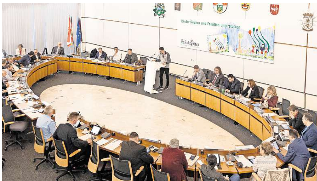
Sitzung am 30. Oktober: Der Rat Salzgitter beschäftigt sich mit den Flüchtlingszahlen.