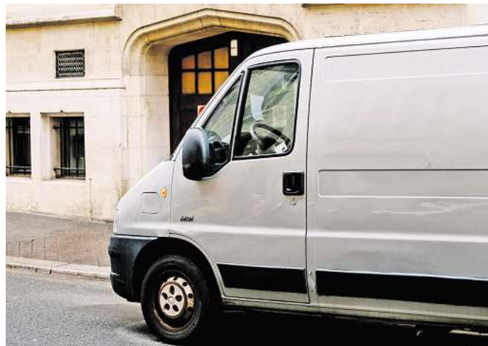
Weiße Lieferwagen sind das Salz in der Suppe von Spekulationen und Angstmacherei.