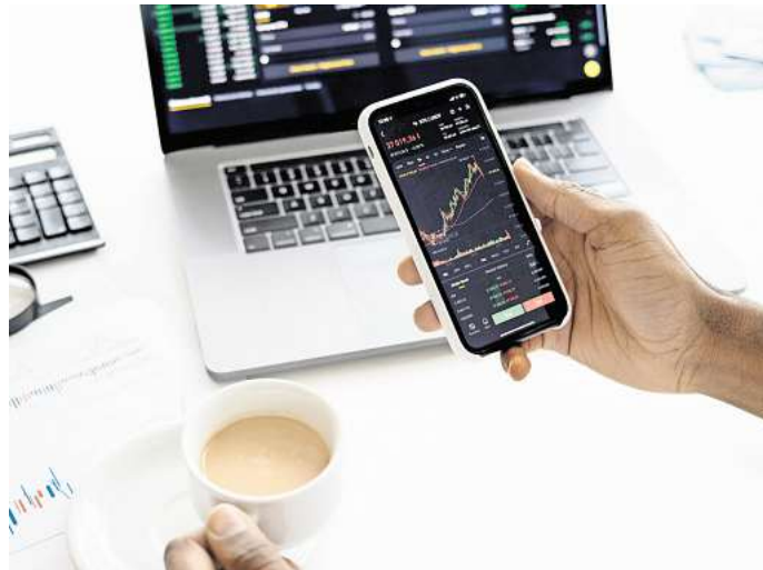
Obacht geben und Unbekannten nicht blindlings vertrauen – nur so kann man sich vor Cyberkriminellen schützen.

Sobald die Kriminellen Vertrauen aufgebaut haben, legen sie ihren Opfern ein Investment nahe. „Sie wollen dabei seriös und vertrauensvoll wirken, deswegen fragen sie zunächst nur nach einer kleineren Summe“, erklärt Sicherheitsexperte Kubovic. Die Täter betonen jedoch stets, dass sie selbst diese Summe wachsen lassen könnten. Und dann beginnt der Betrug erst so richtig.