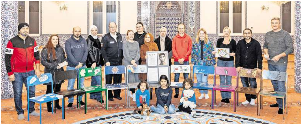
„Mein Platz in der Gesellschaft“: Beteiligte aus den Institutionen, die den Tag der Toleranz in der Yunus-Emre-Mosche feiern, zeigen Exemplare aus der kleinen Stühle-Ausstellung.

Der Aktionstag ist ein passender Anlass, um die eigenen Ansichten und möglichen Vorurteile auf den Prüfstand zu stellen. Vor diesem Hintergrund laden am 16. November verschiedene Institutionen und Organisationen aus Salzgitter von 13.30 bis 17 Uhr in die Yunus-Emre-