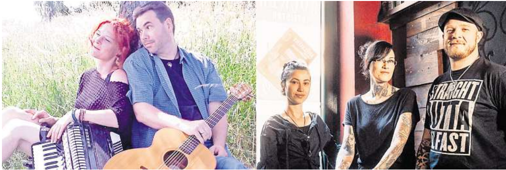
Zwei Bands, ein Abend: Das Duo "The Magpies" und das Trio "The Hoochigans" spielen am 7. Dezember am Fredenberg.