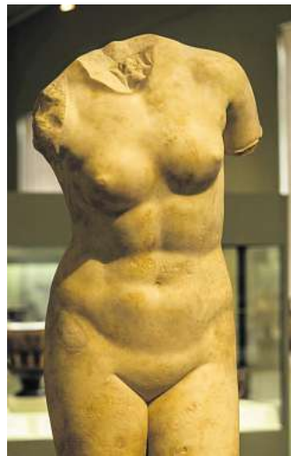
Männer haben oft Wissensdefizite, was den weiblichen Körper angeht.

Der Menstruationszyklus durchläuft immer vier Phasen. Im Schnitt dauert die Menstruation etwa fünf Tage. Die erste Phase ist die Menstruationsphase: Dabei wird die oberste Schleimhautschicht der Gebärmutter abgestoßen. In der zweiten Phase baut der Körper mithilfe von Östrogen die oberste Schleimhautschicht der Gebärmutter wieder auf. Gleichzeitig reift in dieser Phase in den Eierstöcken ein Follikel heran, der etwa eine Größe von zwei Zentimetern beträgt. Anschließend, etwa zur Mitte des ge-